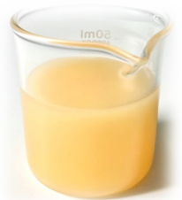
▲ Sirayash Plantix® Oryza