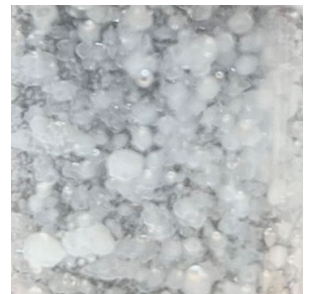
▲ 雪花般的劑型特色

Sirayash Plantix® Oryza 米糠精粹是由優良品種臺東30號米，透過冷榨萃取的活性成分。是世界公認的營養極為豐富， 強抗氧化力 的活性油脂。米糠精粹含有 抗氧化維生素E 、 穀維素 及 維生素B1 ，是款具有極高熱穩定及光穩定的活性油脂，兼具優異的抗氧化能力，除了一般化粧品應用，也適合應用在 熱製 的彩妝品。而油膏狀的米糠精粹添加於化妝水配方中，可呈現出 雪花般 的特色。米糠精粹能在化粧品保養品上進行多重劑型變化，達到 應用面最大化 （保養品、彩妝、髮品）的效果。