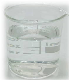
▲ Sirayash Plantix® Balikuan