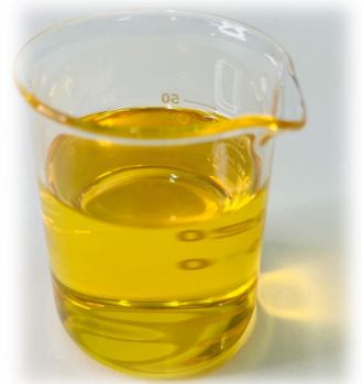
▲ Makatta Simal® Dangka